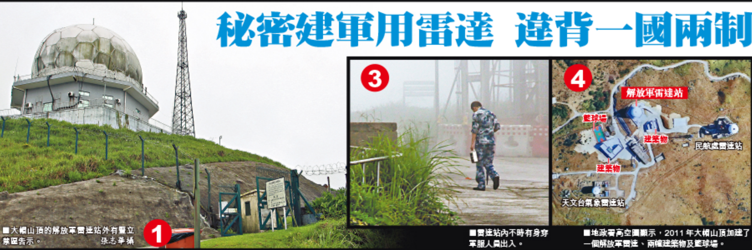
秘密建軍用雷達 違背一國兩制